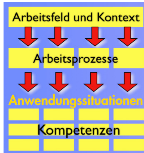
Abbildung: Aufbau Berufsprofil

Dem vorliegenden Rahmenlehrplan liegt der in der nachfolgenden Abbildung dargestellte Aufbau zu Grunde.