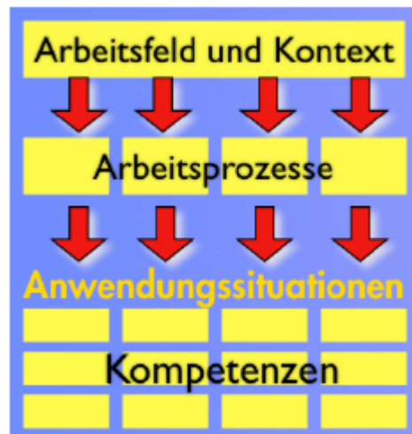
Abbildung 1: Aufbau Berufsprofil

Dem vorliegenden Rahmenlehrplan liegt der in der Abbildung 1 dargestellte Aufbau zu Grunde.